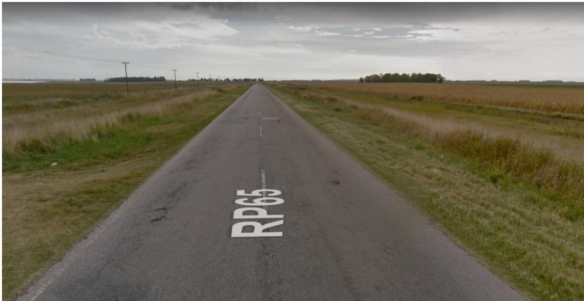
Imagen 3. Deterioro en R.P.N°65. Partido de Guamini