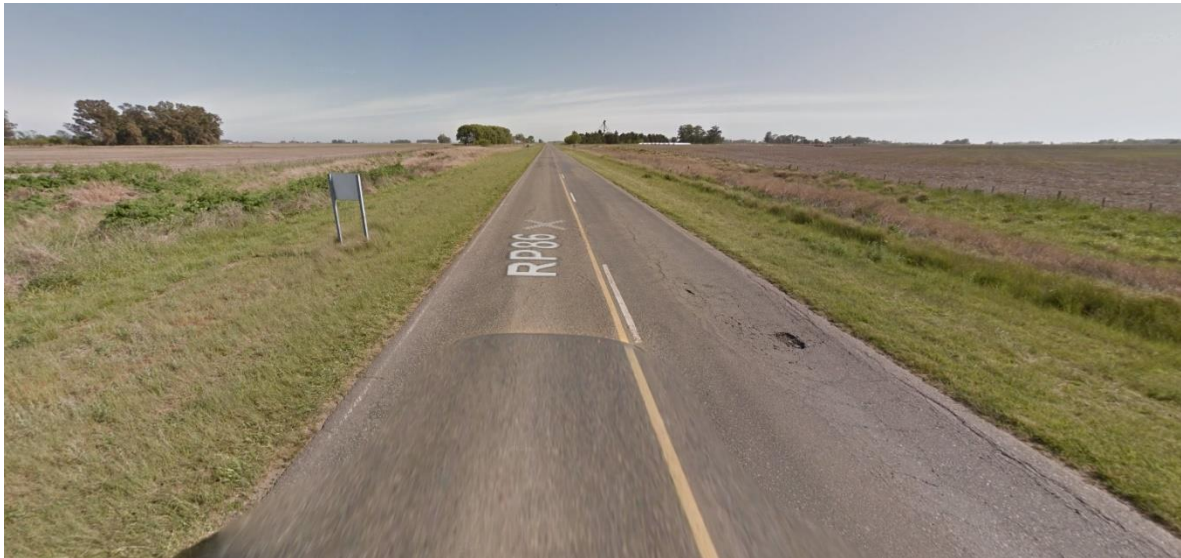
Imagen 3. Deterioro en la R.P. N°86. Partido de Daireaux.