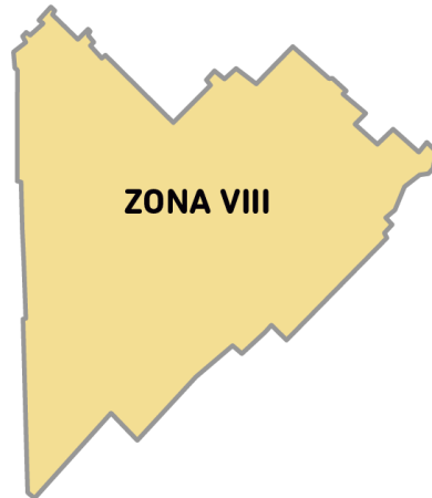
Imagen 2. La Zona VIII está conformada por los Partidos: Adolfo Alsina (Carhué), Bolívar, Carlos Casares, Daireaux, Guamini, Hipólito Irigoyen, Pehuajó, Pellegrini, Rivadavia, Salliquelo, Trenque Lauquen, Tres Lomas.