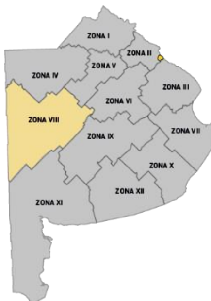
Imagen 1. División de Zonas Viales de la Provincia de Buenos Aires

En las siguientes imágenes se muestra la Zona VIII sobre la Provincia de Buenos Aires, la cual será el área a intervenir: