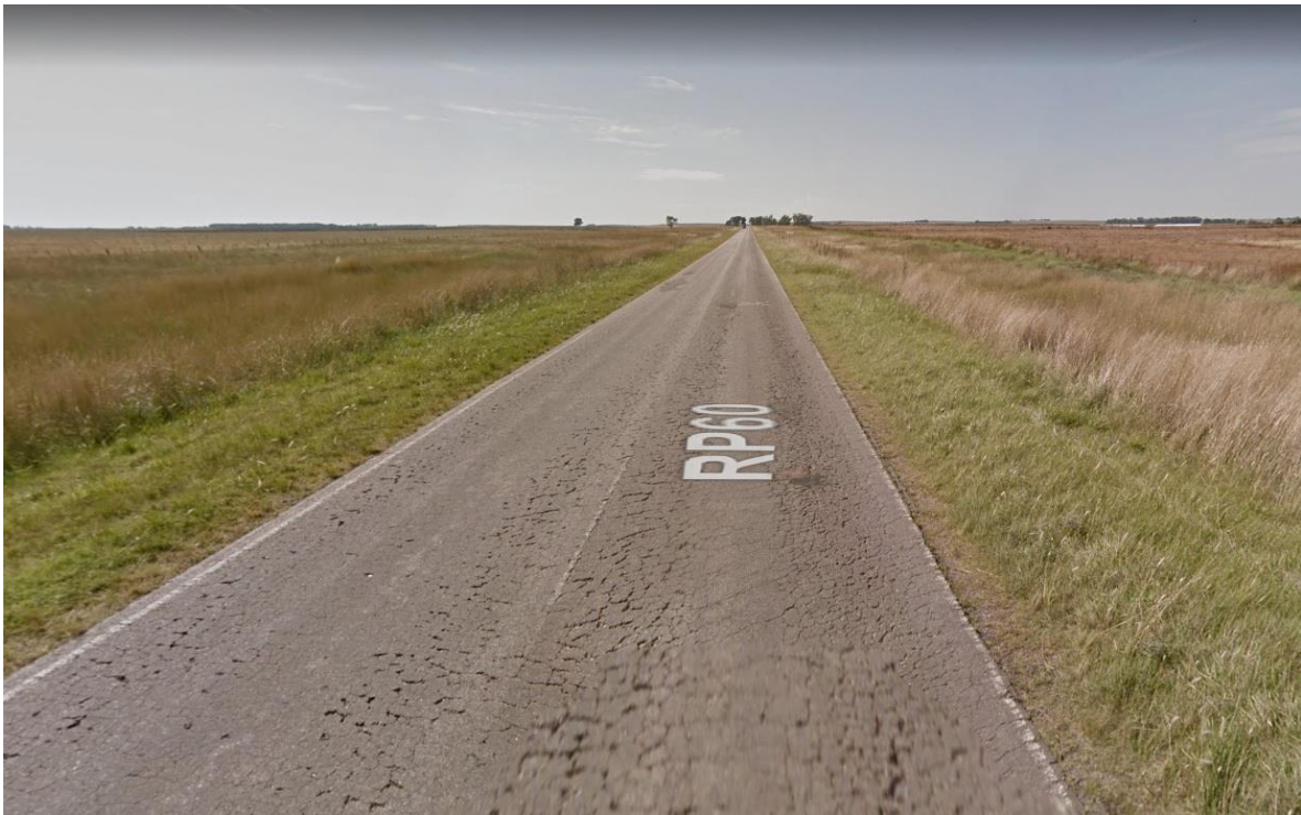
Imagen 4. Deterioro en la R.P. N°60. Partido de Guaminí